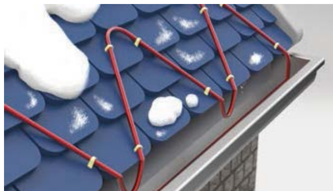
Полиолефиновая/фторполимерная оболочка с УФ-защитой